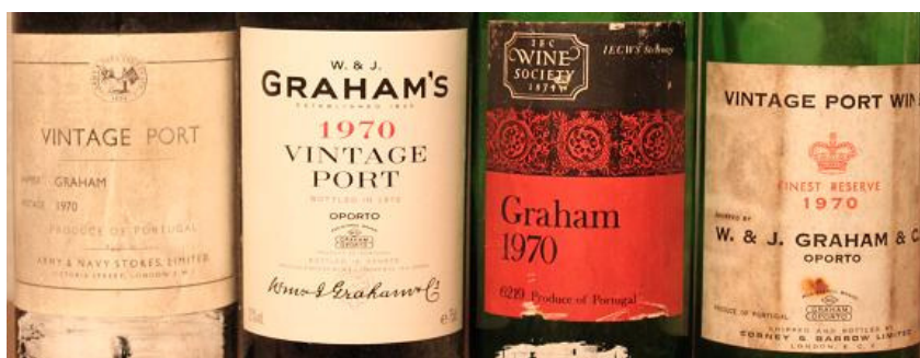
4 verschiedene Abfüllungen des Graham's Vintage Port 1970

Aufgrund der gut proportionierten Tannine sind die Vintage Ports von Graham sehr beständig und zeichnen sich durch eine tolle Kombination von geballter Frucht und einer tiefen Komplexität aus. Aus sentimentalen Gründen habe ich von den Graham's Ports neben dem großartigen 1955er bisher meinen Geburtsjahrgang 1970 favorisiert. Da 1970 das letzte große Jahr gewesen ist, in dem die Vintage Ports noch außerhalb von Portugal abgefüllt werden durften, ist dies auch ein tolles Jahr, um die Einflüsse der unterschiedlichen Abfüller auf den Wein zu entdecken. So habe ich z.B. feststellen können, dass die Abfüllung des Army & Navy Store mehr Komplexität aufweist, als die der original Graham's Abfüllung des gleichen Jahres und die Abfüllung von Corney and Barrow bei unseren Verkostungen oft fehlerhaft war.